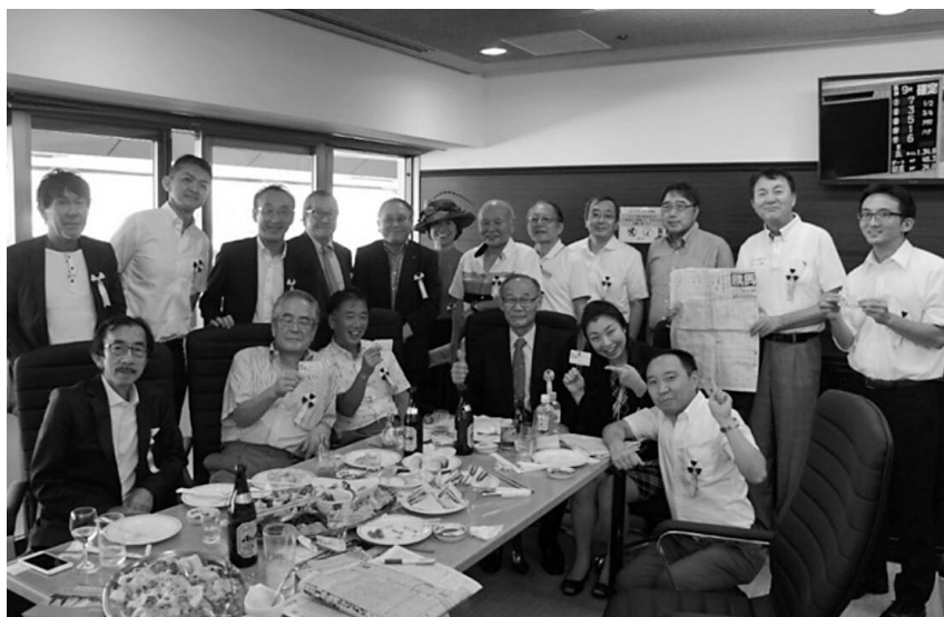
千葉県校友会 平成30年度 懇親会 平成30年9月23日 於 中山競馬場貴賓室